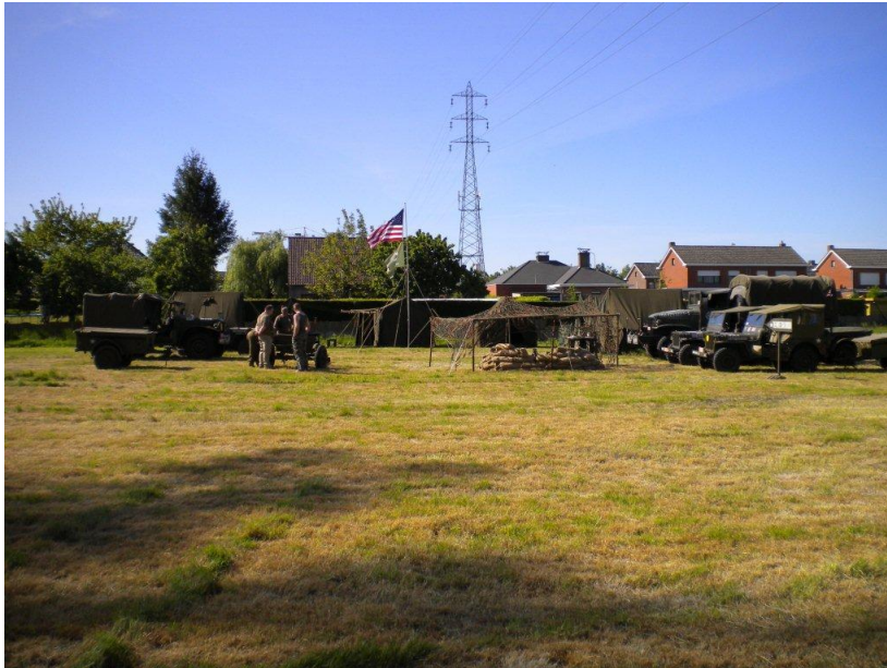
Het WSD kampement tijdens dit zonnige weekend.

Gelet op de ligging van de centrale wordt verdere uitbreiding onmogelijk en wordt beslist een nieuwe centrale te bouwen te Ruien, die in dienst wordt gesteld in 1958.