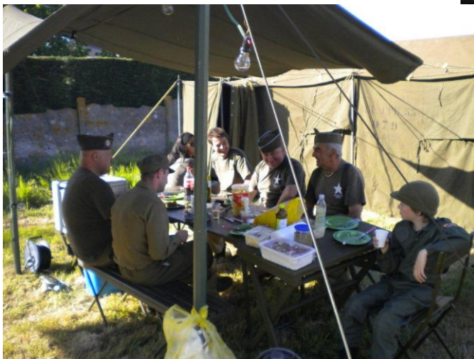
Gezellig samen eten onder de shelter.